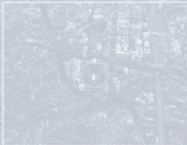
Stade de France (48.9242 , 2.3599)